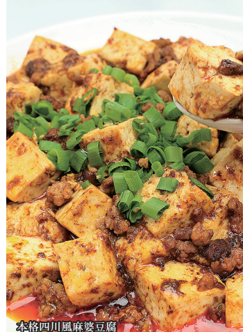
本格四川風麻婆豆腐