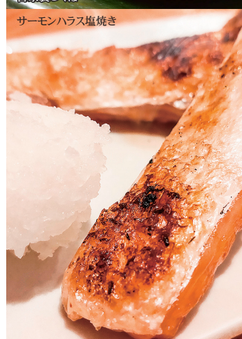
サーモンハラス塩焼き

サーモンハラス塩焼き 税抜二九〇円 (税込三一九円) 自家製つくね 税抜四九〇円 (税込五三九円) 韓国チヂミ 税抜四九〇円 (税込五三九円) 激辛チヨリソ 税抜四九〇円 (税込五三九円) ウインナー 税抜四九〇円 (税込五三九円)